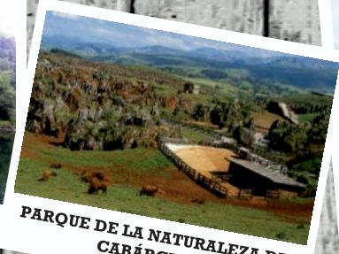
PARQUE DE LA NATURALEZA DE CABÁRCENO