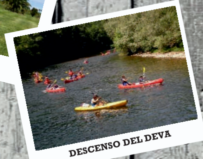
DESCENSO DEL DEVA