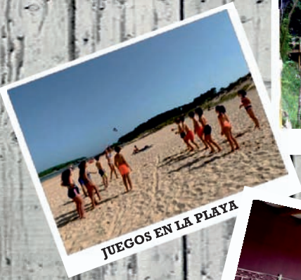
JUEGOS EN LA PLAYA