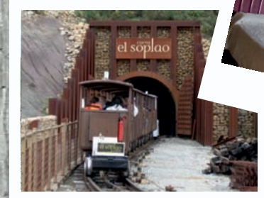
CUEVA DEL SOPLAO