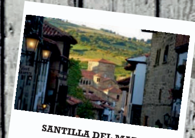
SANTILLA DEL MAR