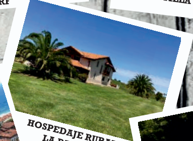
HOSPEDAJE RURAL LA PANERA